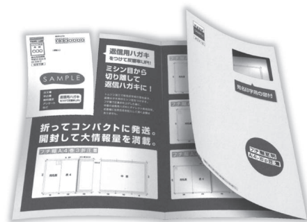
窓開フチ糊圧着DM（ハガキ付）

両面印字可能なサイズは、V折ハガキ、Z折ハガキ、A4-4P、A4-6Pまで対応。また、各種バー