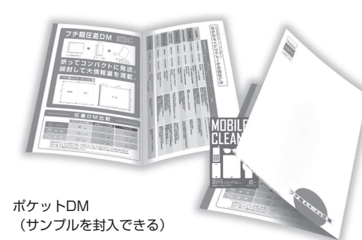
ポケットDM (サンプルを封入できる)

トムソンによる抜きを付加したインパクト抜群のトムソン型DM。オリジナル圧着にも対応し、見本のDMは、仕上がりサイズ210×256mm、展開サイズ420×256mm。推奨用紙マットコート、標準紙厚135kベース。